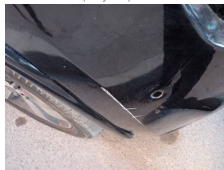
Bouclier avant (Rayure)