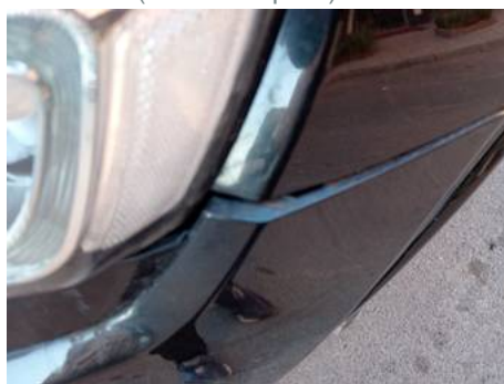
Bouclier avant (Défaut aspect)